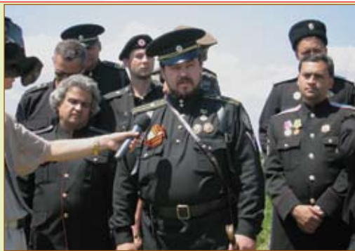
Интервью атамана ВВКЧ им. Суворова

Казаки обсуждали информацию, что возобновляется практика Всеправославных совеща-