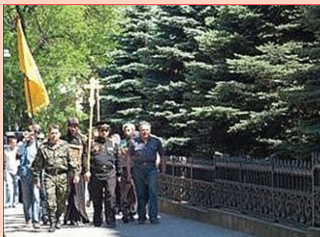
Крестный ход идет около здания СБУ в Одессе