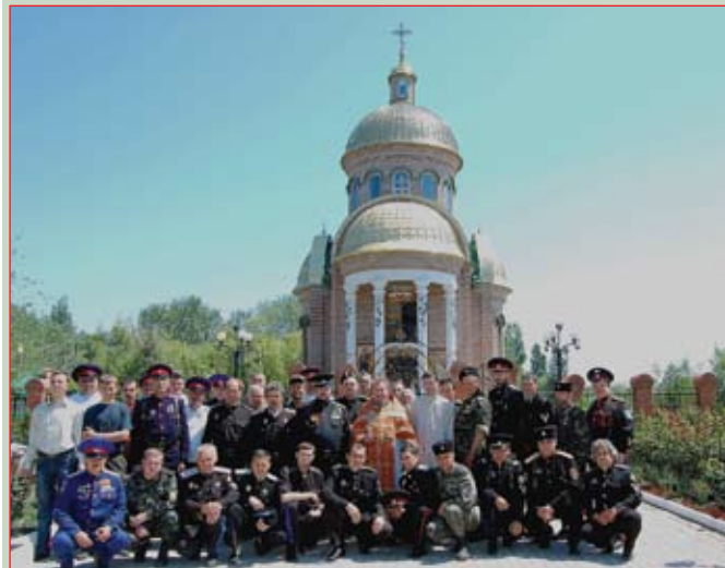
У храма св. Пантелеимона