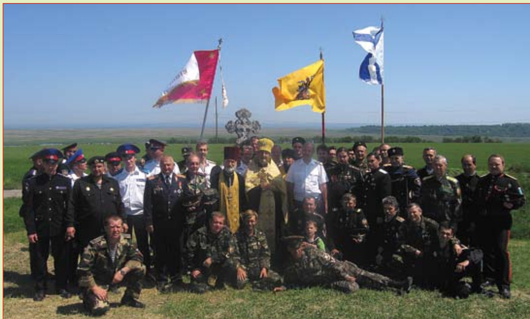
Казаки у Креста

Публикация содержательных авторских статей в нашей газете приветствуется!