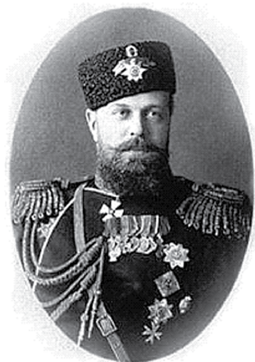
Император Александр III

«Низкое и злодейское убийство Русского Государя, посреди верного народа, готового положить за него жизнь свою, недостойными извергами из народа, есть дело страшное, позорное, неслыханное в России и омрачило всю землю нашу скорбью и ужасом.