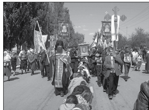
Дети на коленях перед Богородицей

Начав движение 7 апреля из Кишинёва, крестоходцы уже 20 мая вошли в Севастополь. Главной святыней этих Крестных Ходов является икона «Умиление» (из пос. Локоть Курской области). Из неё постоянно идёт мирооточение. А также икона Курская-Коренная «Знамение». Обе они связаны с жизнью прп. Серафима Саровского. Икона «Умиление» двусторонняя, и она отображает две стопочки Богородицы, которая как-бы и проходит крестными ходами по Руси. Прямая цель этих крестных ходов — объединение славянских народов: великороссов, белоруссов и малороссов в единой славянской Православной