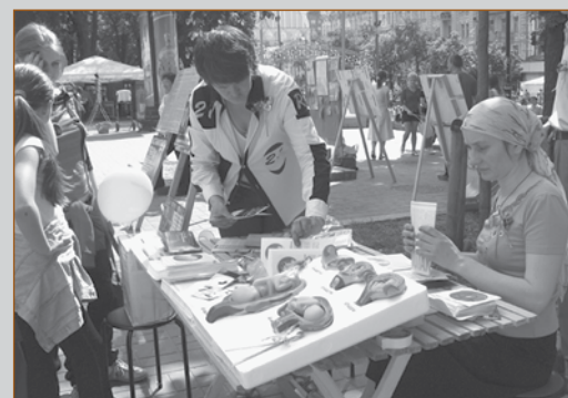
Акция «радость материнства» в Киеве

торые желали присоединиться к движению «Спаси и сохрани» и принять активное, действительное участие в нем. Такие же акции единомышленниками движения были проведены в этот день в Днепропетровске, Черновцах, Луганске, Житомире, Херсоне, Виннице, Каховке, а также первого июня — в Белой Церкви и Ялте.