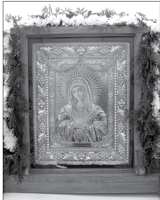
Икона Богородицы Умиление

Судя по реакции епархиальных владык, сей Крестный ход был нежеланным гостем. Одесса его передавала из рук в руки, как горячие угли побыстрей, лишь бы с глаз долой. Приходы даже не были оповещены заранее о приближении такого шествия. Лишь за день, на скорую, готовились условия для приёма. Многие просто не хотели принимать, ссылаясь на занятость. Наверное, больше опасаясь, чтобы не досталось от епархии «на орехи». К тому же, только перейдя молдавскую границу, члены Крестногохода были почему-то объявлены одесской епархией сектантами. Постоянный поиск не каноничес-