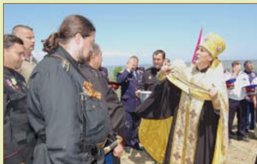
Окропление после благодарственного молебна

В связи с этим было принято Обращение казаков к Патриарху РПЦ МП Кириллу , визит которого намечен в Киев на 27 июля с.г.: