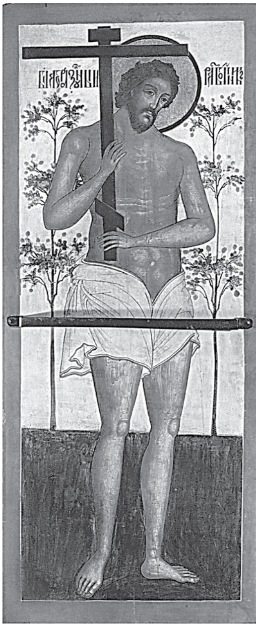
Икона «Благоразумный разбойник»

Сейчас деятельное (не только на словах) противление глобализации — главный вопрос аскетике. Это уже не просто безплотный враг, а в некотором смысле «воплощенный», и процесс глобализации в конце концов обязательно закончится воцарением антихриста. Действовать — нужно не когда-нибудь «тогда», а — сейчас! Нужно полюбить истину всем сердцем и на деле, во еже спасится нам. Иначе —