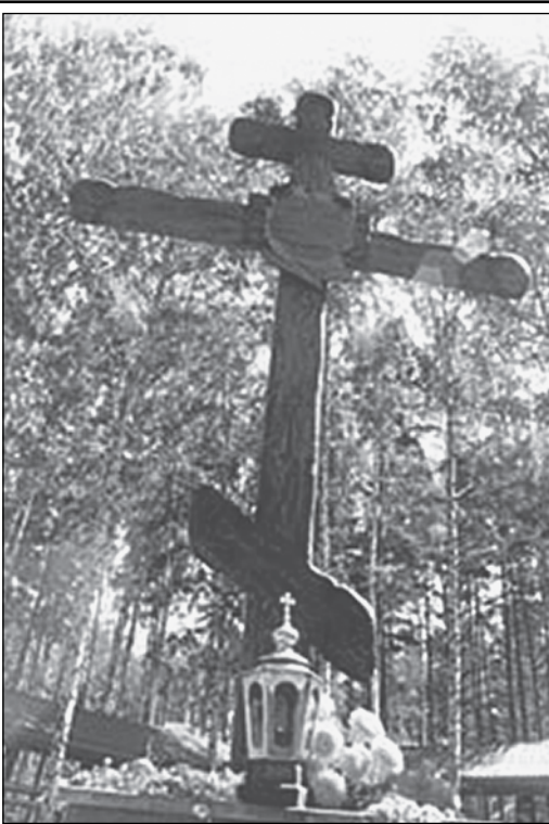
Царский Крест на Ганиной Яме

17. При закладке Креста положить в его основание: