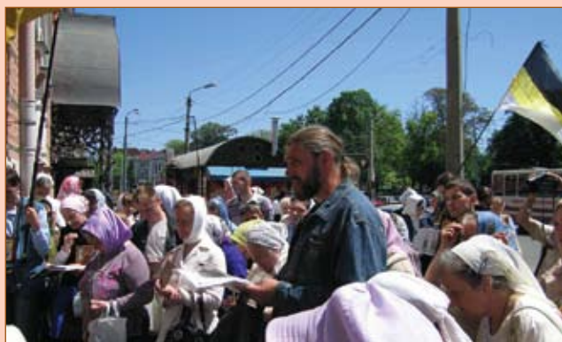
Акафист царю-искупителю Николаю II