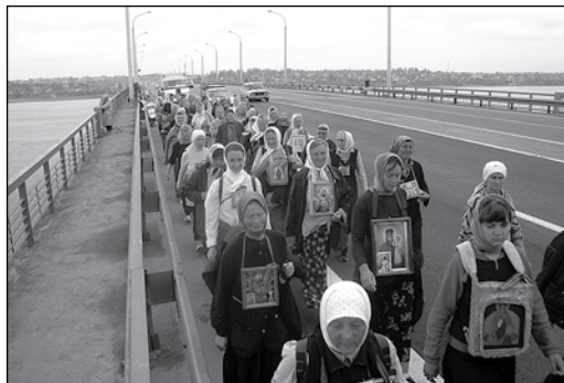
Матушки крестным ходом форсируют Днепр

ких икон таковых не обнаружил. И на границе с Николаевской епархией вновь встречался «сектантский», по наговорам, Крестный ход. Видно это был лишь повод, удобный прикрыть истинное нежелание принимать шествие. Пока, якобы осторожно изучалось, кто это, путь уже и пройден. Но почему же? Если обратить внимание на несомые флаги, то они монархические. Ведь объединение Руси возможно лишь под властью Православного