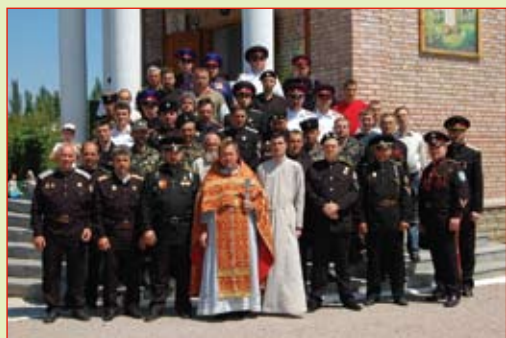
После литургии у храма

Утром все казаки прибыли в Свято-Пантелеймоновский храм на Божественную литургию. По окончании Богослужения был отслужен молебен, после которого все присутствующие могли приложиться к святыням храма, которых в этом святом месте было в избытке. В это время хор исполнил народный гимн-молитву «Боже, царя храни!» и многие присутствовавшие дружно подпевали.