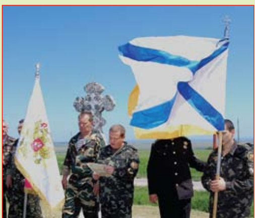
Присяга на верность Богу и Черноморскому Казачеству

На этом святом для казаков месте они собрались, чтобы почтить память наших славных предков-защитников Руси Святой. После благодарственного водосвятного молебна, были приняты новые казаки в ряды ВВКЧ им.Суворова – на Кругу принималась присяга на верность Богу и Черноморскому Казачеству через целование Креста Животворящего и Священного Евангелия. Атаман поздравил и лично вручил войсковой знак. Казаки спели народный гимн-молитву «Боже, царя храни!».