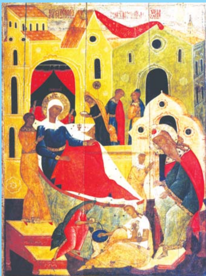
Рождество святого Иоанна Предтечи.

"На асао возсоздания Свѣтой Руси никакого спеціального благословенія не надо. Вы и так имѣете его внутри себя." Митрополит Иоанн (Снычков)