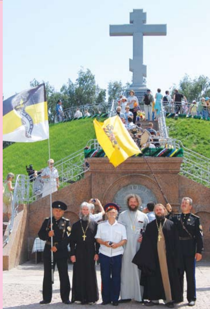
Черноморцы и духовенство в Полтаве у Кургана Славы.

В Полтавской битве была разгромлена лучшая в Европе армия, почти сто лет не знавшая поражений. Ее король бежал, бросив своих солдат. Ее полководцы оказались в плену. Почти двадцать тысяч шведов сложили оружие через несколько дней на берегу Днепра перед кавалерийским отрядом князя Меншикова. Значение победы русского воинства под личным предводительством Государя Петра I над шведским войском Карла XII трудно переоценить. Тогда на одной чаше весов находилось единство русского православного народа, а на другой - его новое разделение, оккупация иноземцами Православной Малороссии и присоединение ее к католической Польше. В случае победы шведов под Полтавой им открывался бы путь на Москву. Завоевание войском иноверцев Земли Русской привело бы не только к утрате русским народом своей независимости, но и неизбежно вызвало бы гонения на Православную веру и, в конце концов, поставило бы под угрозу само существование Русской Православной Церкви.