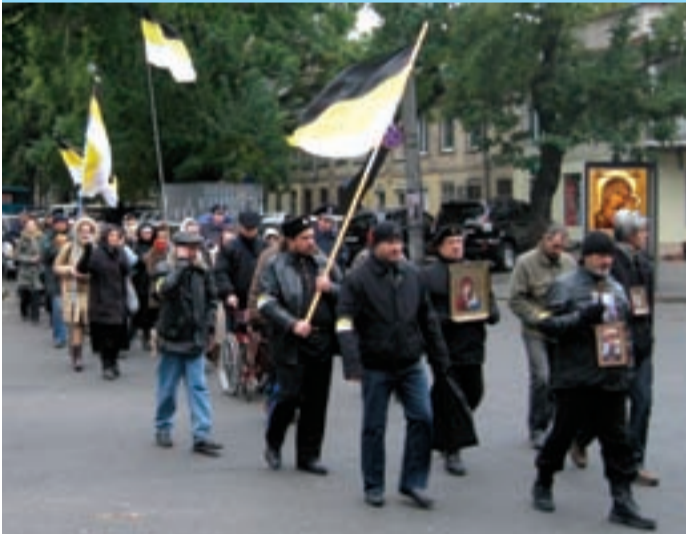
В день празднования иконы Божией Матери Казанская, в Одессе состоялся Крестный ход, посвященный единству России-Белорусии-Малороссии, единству триединого славянского народа Святой Руси.

Православные патриоты, активисты Духовно-патриотического союза «Новороссия», а также верные казаки-черноморцы ВВКЧ Святого Государя Императора Николая II, собрались днем 4 ноября на Куликовом поле в Одессе, в память освобождения Москвы от поляков (1612г.), чтобы пройти Крестным ходом и помолиться Божией Матери и всем святым об освобождении от жидовского ига.