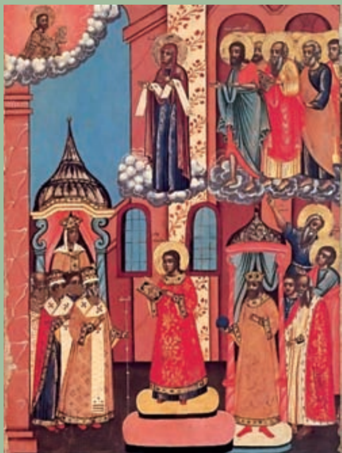
Покров Пресвятыя Богородицы.