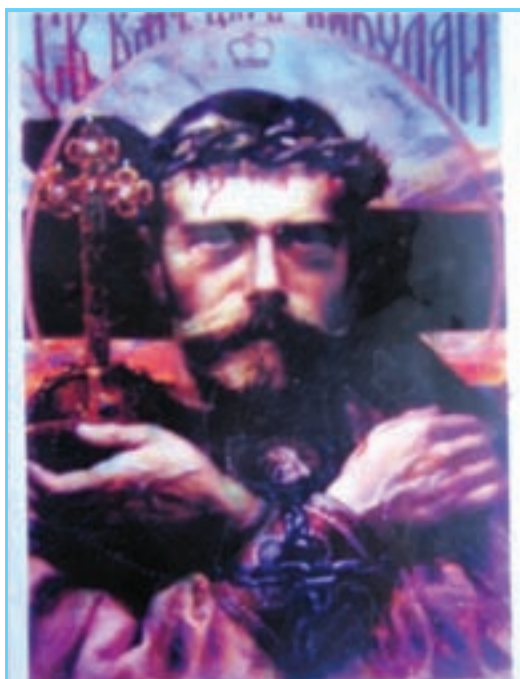
Мироточивая Икона Святого Царя-искупителя Николая Второго Из записок паломницы по Белгородской земле.

На Руси-Матушке много святых мест, еще больше её святых заступников. И чем глубже русский народ осознает причину своего духовного падения, тем более стремится к покаянию, возвращаясь к тем временам, когда Россия потеряла самое дорогое: своего любимого царя-батюшку!