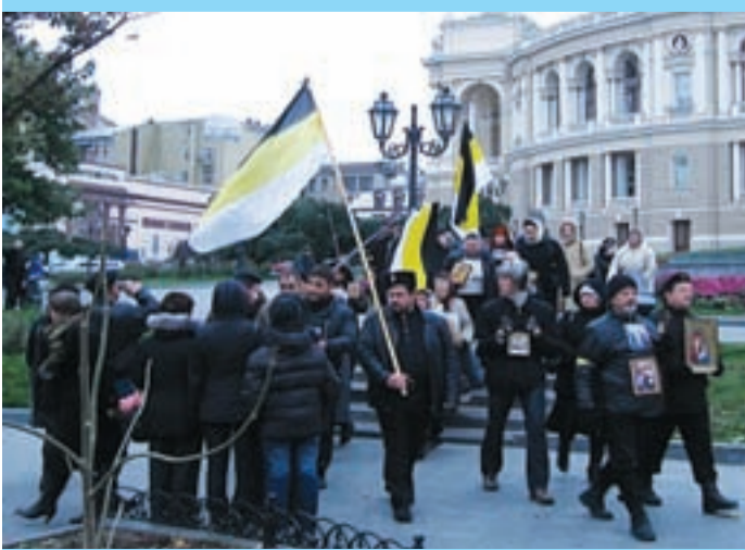
(Окончание на стр. 6)

Организаторы огласили ОТКРЫТОЕ ОБРАЩЕНИЕ К ПАТРИАРХУ РПЦ МП И ВЕРНЫМ ВСЕЙ ПОЛНОТЫ РУССКОЙ ПРАВОСЛАВНОЙ ЦЕРКВИ: