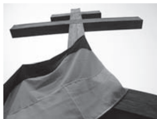
Православие – Самодержавие – Народность!!!

4 октября 2009 года исполнилось 90 лет со дня формирования в городе Харькове 3 – го Офицерского генерала Дроздовского стрелкового полка. За все время Гражданской войны в боях с большевиками погибло более 15000 дроздовцев. Казаки ЧГКО «Пластунъ» в меру своих сил и возможностей занимаются реконструкцией формы одежды и традиций 3 – го Офицерского генерала Дроздовского стрелкового полка.