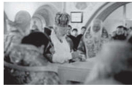
Освящение престола Митрополитом Владимиром

6/19 октября 2009г. в Свято-Успенском мужском монастыре г.Одессы был освящен храм в честь преподобного Кукши Одесского. Это нижний храм новопостроенного собора монастыря, верхний же храм предполагается освятить в честь Иконы Богоматери «Животворный источник». Насколько известно, это первый храм в честь святого Кукши – великого прозорливца и чудотворца.