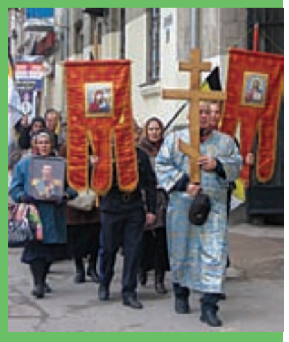
(Окончание на стр. 5)

Активисты партии Русский Блок, Русской общины Севастополя провели 4 ноября у памятника Екатерине Второй небольшой митинг, посвященный Дню русского единства. Помимо призывов к единению русского, украинского и белорусского народа, на нем прозвучали и более злободневные лозунги.