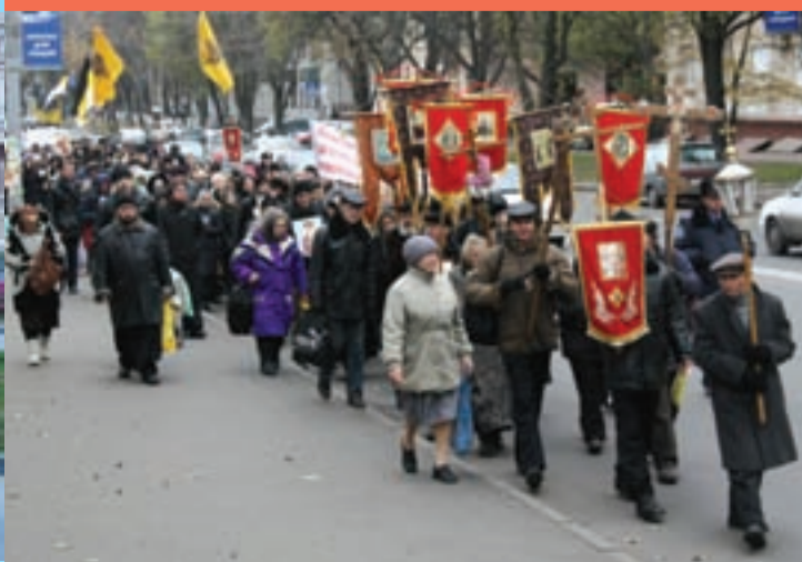
(Окончание на стр. 2)