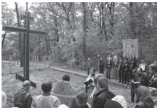
Освящение Поклонного креста

Святой благоверный Олег Романович, в крещении Леонтий, князь Брянский, был внуком князя Михаила Черниговского, замученного в Орде татарами. Святой Олег был равнодушен к богатству и мирской славе. Его больше всего привлекала монашеская жизнь. Поэтому, уступив свой престол брату он постригся в монахи. При постриге его нарекли Василием. Святой Олег стал известен строгостью своей монашеской жизни. Он мирно скончался в своем монастыре около 1289 г. Его мощи почили в Петропавловском Брянском монастыре, им построенном.