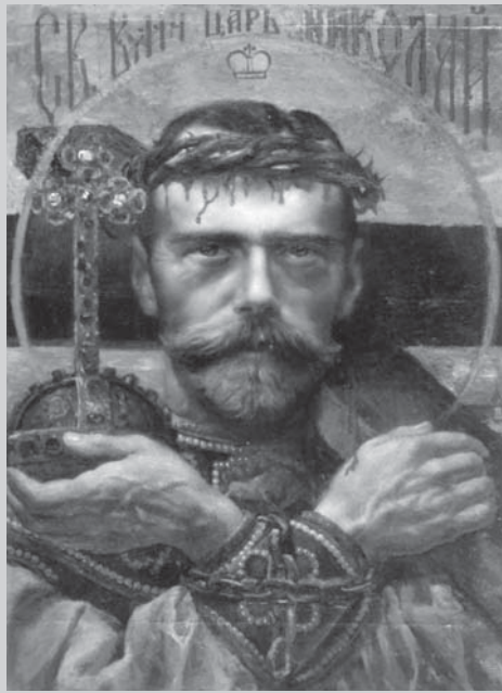
ИКОНОГРАФИЯ ЦАРЮ-ИСКУПИТЕЛЮ НИКОЛАЮ

Сила Вышняго осени тя, Святый Царю Николае, Волю Святую Царя Небеснаго на земли смиренно творити и Государством