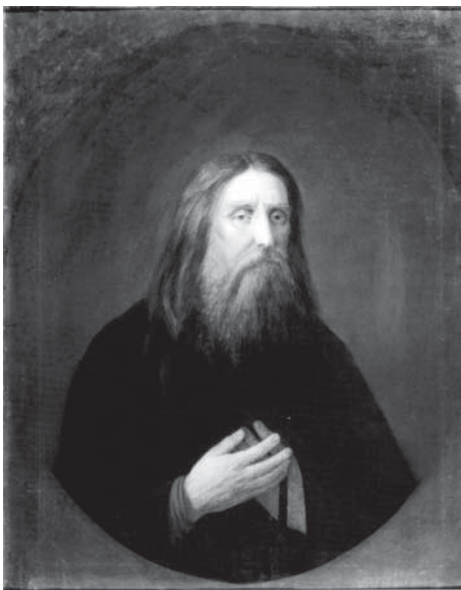
Преподобный Серафим Саровский.

Олег Платонов в своей книге "Терновый венец России", описав состояние масонства в Царствование Александра II, приходит к такому выводу: «Все эти движения <...> составили идеологию российского революционного движения 70-80-х годов, идеологию политическое бандитизма, кульминационным действием которого стало убийство Александра II. Этот Царь зашёл слишком далеко в уступках антирусскому подпольному движению, а когда спохватился, то было уже поздно, ибо венцом этого движения всегда было цареубийство» 27 .