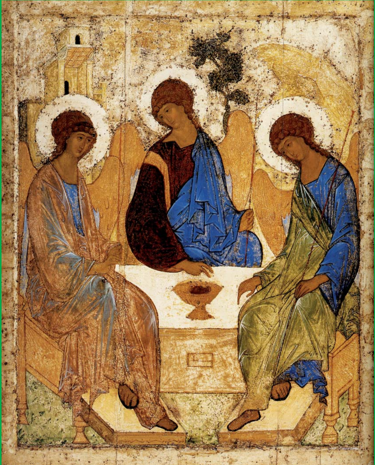
Пресвятая Троица. Андрей Рублев. Около 1411 г.

"На асаа воссоздания Святой Руси никакого специального благословения не надо. Бы и так имеем его внутри себя." Митрополит Волод (Сысцев).