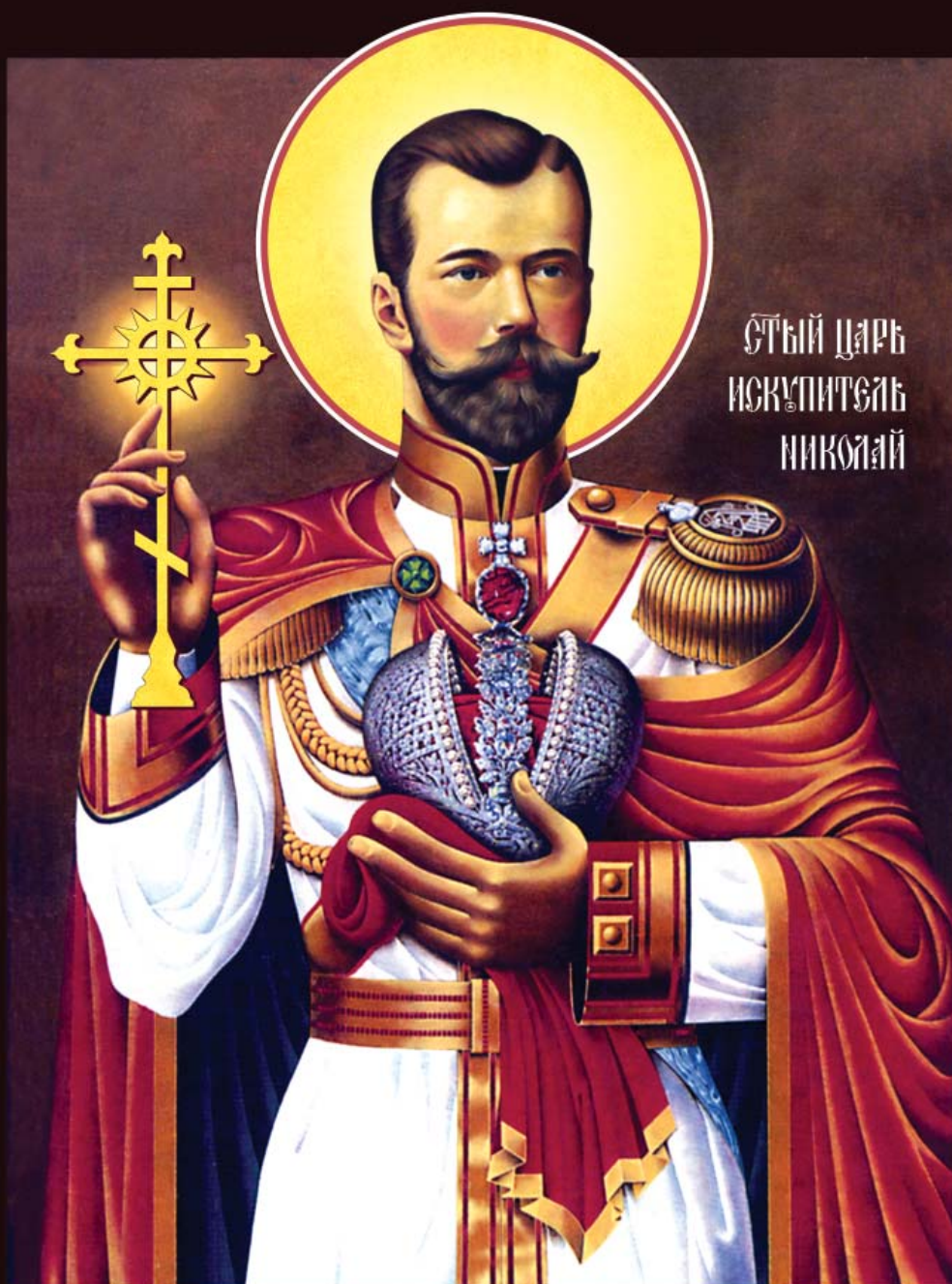
СВЯТЫЙ ЦАРЬ ИСКУПИТЕЛЬ НИКОЛАЙ