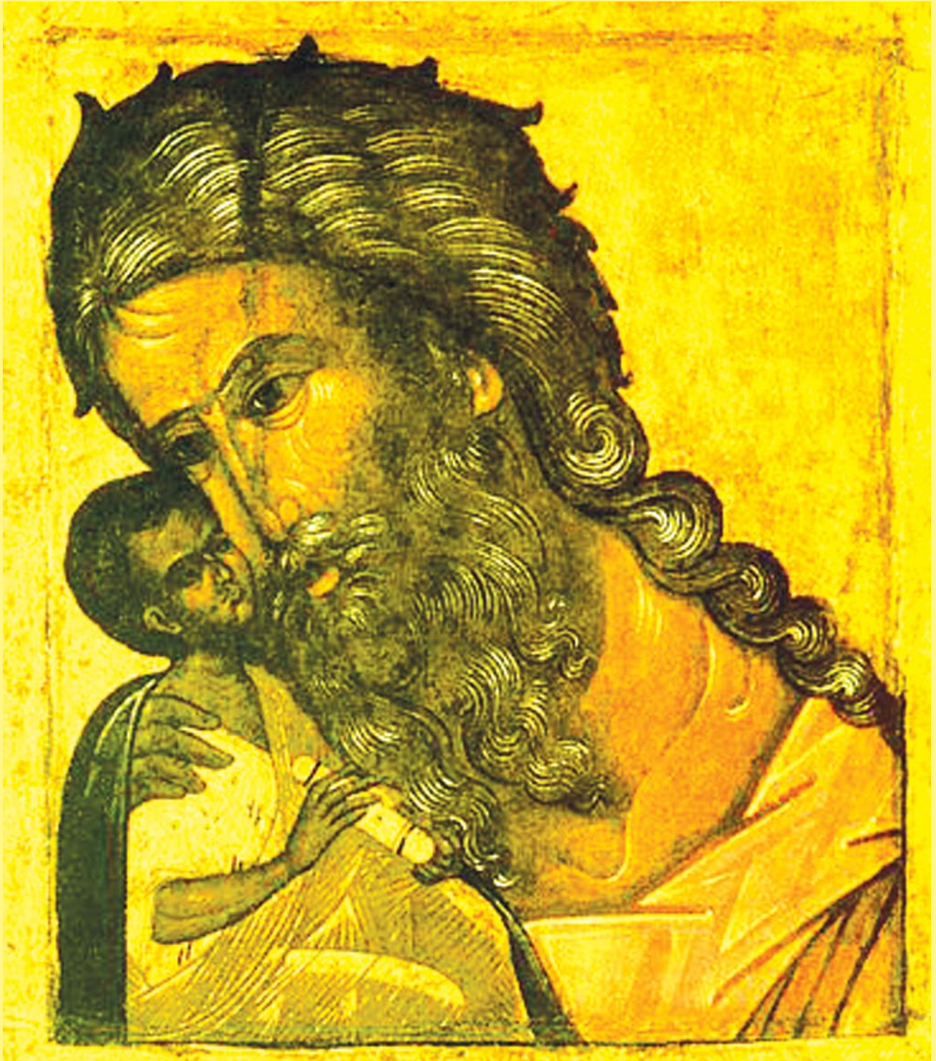
ПРАВЕДНЫЙ СИМЕОН С БОГОМЛАДЕНЦЕМ