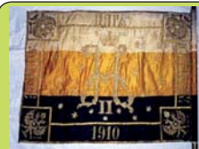
Знамя Русского Монархического Союза